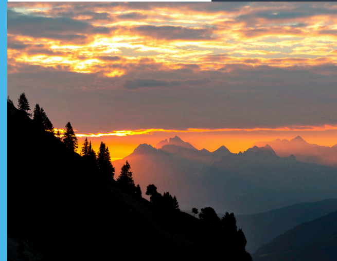
Les Cars de la Région Auvergne-Rhône-Alpes

*sur présentation d'une carte mobilité inclusion toutes options et/ou de la carte régionale illico Mobilité à compter du 1 janvier 2022. À compter du 1 janvier 2022, la gratuité est offerte aux accompagnateurs de personnes en situation de handicap, titulaires de la carte mobilité inclusion toutes options et/ou porteuses de la carte régionale illico Mobilité. La gratuité est offerte aux enfants de moins de 6 ans accompagnés par un adulte. ■ La tarification Décllic 1 ne s'applique pas à l'intérieur des ressorts territoriaux indiqués dans le guide des transports en Haute-Savoie. Bagage supplémentaire : 2 € pour les zones 1,2 et 3, 3 € pour la zone 4. Vous pouvez consulter les conditions générales de vente et de transport à bord des autocars.